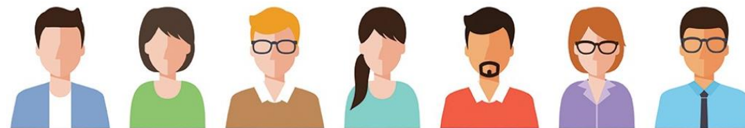
Representantes Públicos y Privados