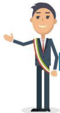
Presidente Grupo de Trabajo (Alcalde)