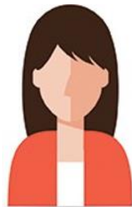
PROMSA del EESS