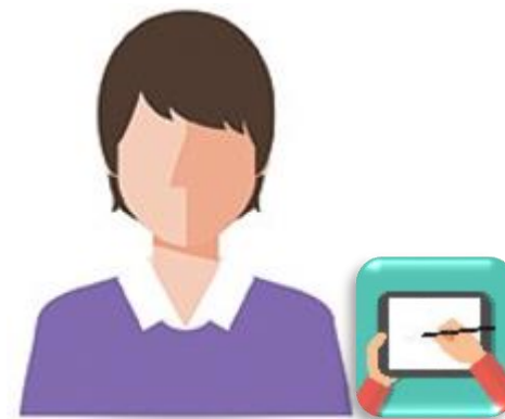
Coordinador de visitas domiciliarias